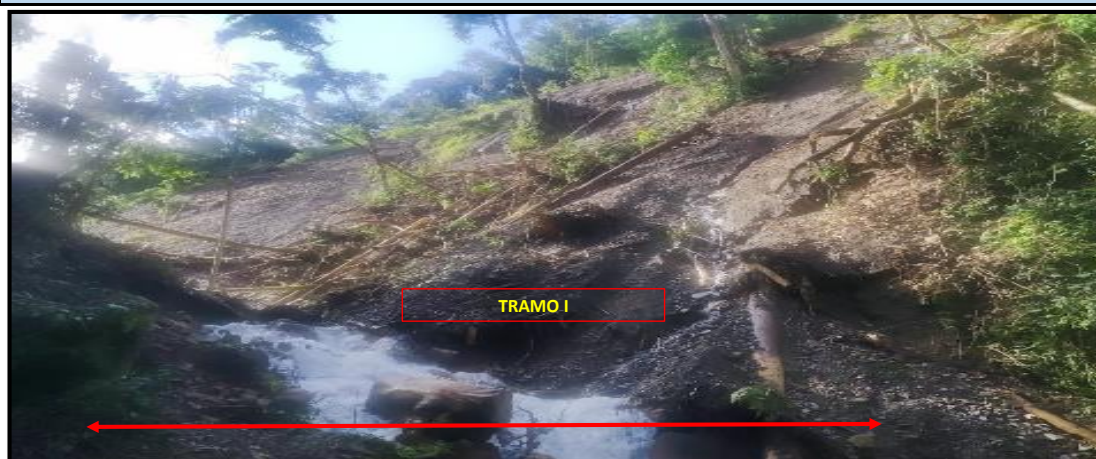
FOTO N° 01: MUESTRA EL TRAMO I A DESCOLMATAR DE LA QUEBRADA CARMENALTO (TUNQUIMAYO).