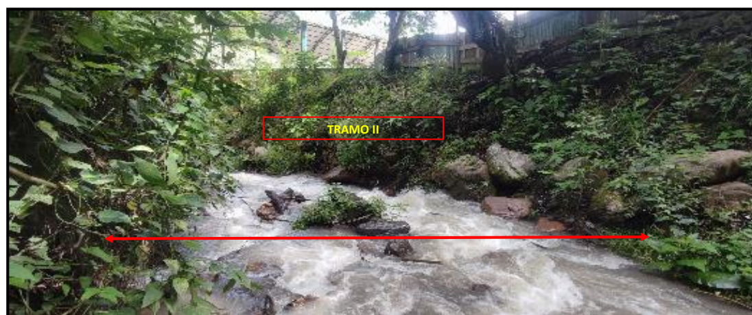
FOTO N° 02: MUESTRA EL TRAMO II A DESCOLMATAR DE LA QUEBRADA CARMENALTO (TUNQUIMAYO).